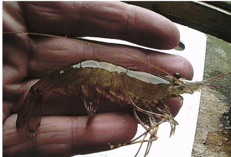
Béile breá blasta: An Phéist Ribe ( Crangon crangon ) agus an Cloicheán ( Palaemon serratus )

a bhaint amach as an uisce agus ligean dóibh fuarú. Tá i bhfad an bharráocht trioblóide ann leis an chraiceann chnámhach a bhaint uilig den chloicheán nó den phéist ribe agus is é an rud a ghnímse, de ghnáth, an cloigean a bhaint díobh agus an fheoil a fhágáil mar atá sa ruball. Bheir sin luach cnagtha duit nó crunch value nuair a itheann tú do chuid. Sinséar agus gáirleog agus cillí in ola olóige agus caith isteach na cloicheáin nó na péistí ribe bruite. Is maith liom iad sin a chur ar leaba ríse atá measctha le glasán — sin cineál de leitís mara. Mar a bhuailfeá do dhá bhos ar a chéile, tá béile breá blasta eile os do chomhair amach réidh le hithe agus le blaiseadh.