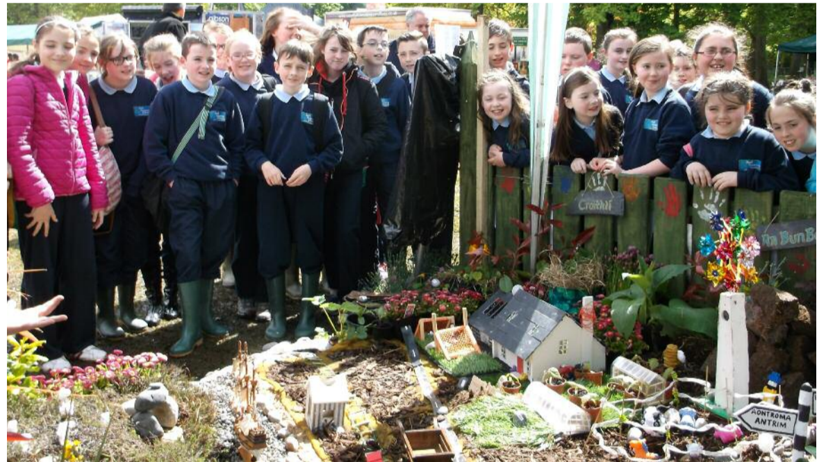
Páistí Scoil Phódraig Dobhar ag ócáid bronnta na nduaiseanna i gcomórtas Garden Show Ireland i gCo. Aontroma.