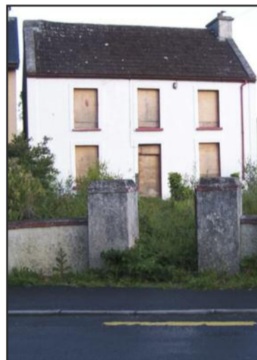
Teach athmhaisithe ( thuas agus ar dheis ) mar chuid d'iarracht Gort an Choirce do Chomórtas na mBailte Slachtmhara