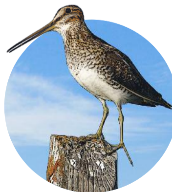
Colún Nóra Chit

Bhí go maith agus ní raibh go dona. Ar mo bhealach amach ó Chill Mhic Réanáin bhuail an fón póca ag mo thaobh. Níor fheagair mé é ach, ar feadh bomaite beag, thóg mé mo shúile den bhealach. Ba leor sin. Bhuail na rotha ar an taobh chlé in éadan céime ar thaobh an bhóthair, úr-thógtha ansin ag an Comhairle Condae le tabhairt ar thiománaithe – agus ní