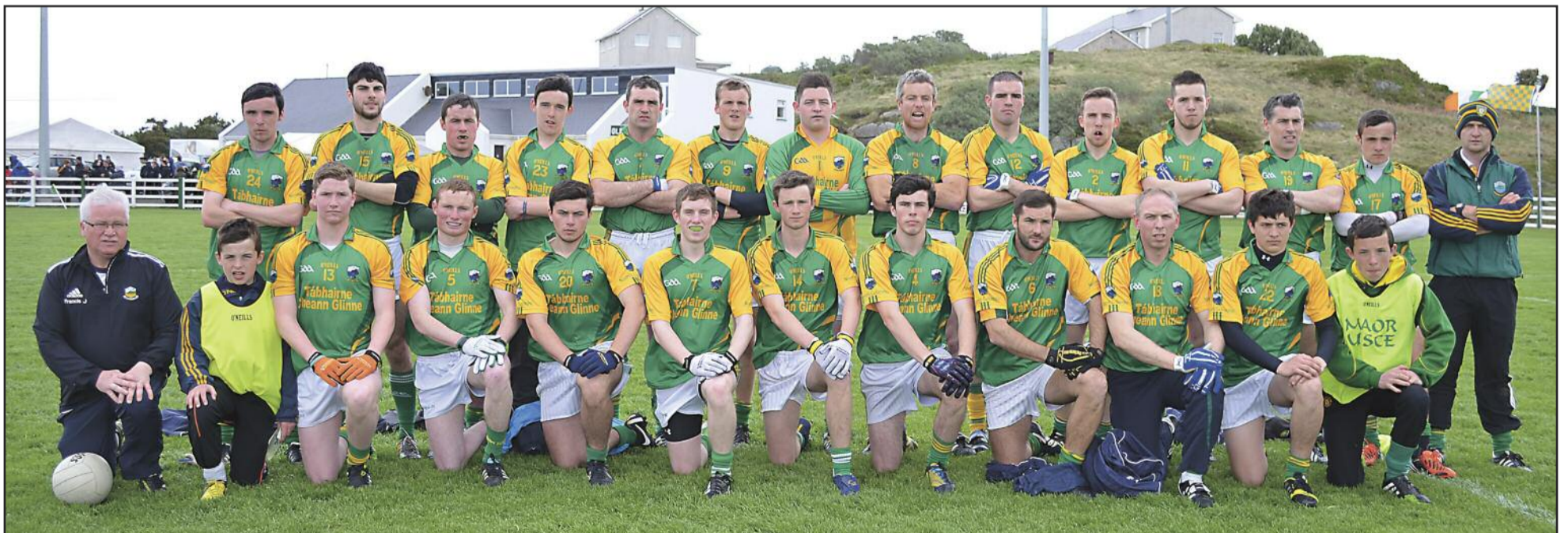
Tá foireann Naomh Columba ann a bhain Comórtas ceannais Shóisear Thír Chonaill i mbliana.

Tá liosta iomlán na gcluichí le fáil ag www.maighcuilinn.com