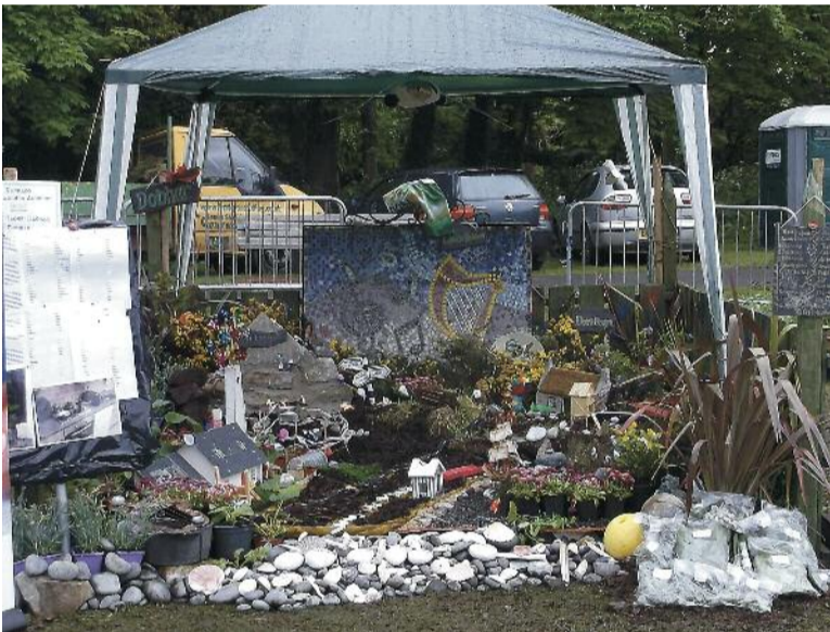
An garradh pailéid a bhain an dara háit i gcomórtas Garden Show Ireland i gCo. Aontroma, togra trasphobail idir Ionad Naomh Pádraig, Scoil Phódraig Dobhar, National Learning Network, Solas, Brainse Dhoibhair de Chumann Cathaoir Roth na hÉireann, Club Óige Dhoibhair.

Freagra puzzle 1: 13 thriantán; Freagra puzzle 2: 3 (suirbh an uimhir os cionn agus ar thabh na lámhe deise den bhocsa. 2+1=3 )