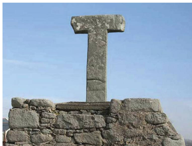
An Chros Tau ar Oileán Thoraí

Intreoir do sheandálaíocht a bhaineann le Colm Cille @ naoimh eile i seanpharóiste Thulacha Beigile agus turas gairid bus mar pháirt de.