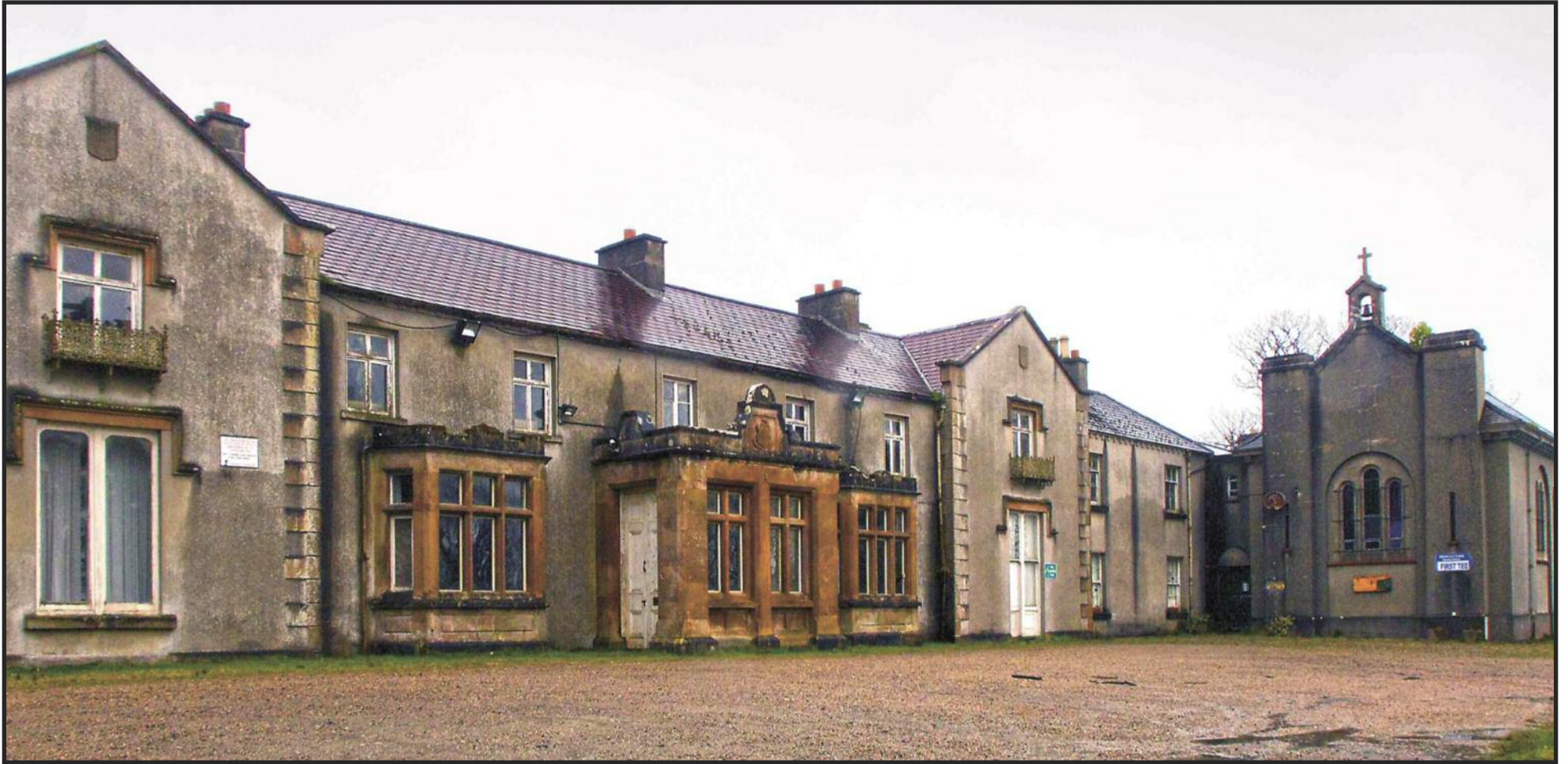
Tá cainteanna ar bun le hIonad Athshlánaithe de chuid Cuan Mhuire a fhorbairt in Teach Bhaile Chonaill le cóir leighis ar fáil do andúiligh drugaí agus alcóil.