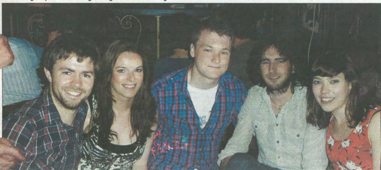
Baill den ghrúpa An Modh Díreach roimh dul ar stáitse an Chabaret Craiceáilte dóibh,