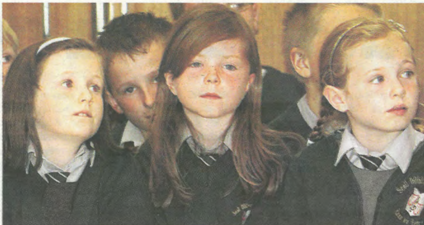
Scoláirí ó Scoil Rann na Feirste ag ócáid cheiliúrtha Áislann Rann na Feirste