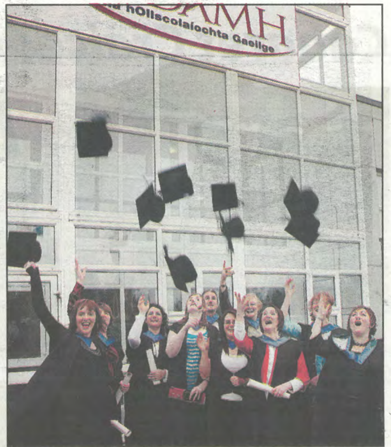
Mic léinn ag ceiliúradh taobh amuigh d'Ionad an Acadamh i nGaoth Dobhair

"Bhí iontas orm cé chomh gasta agus a d'éirigh mé cleachtaithe le hoideachas tríú leibhéal i Meán Fómhair anuraidh. Oireann an clár ama dom. Siocair nach mbíonn ranganna ar bith ann san iarnóin, bím ábalta bheith sa bhaile nuair a thig mo