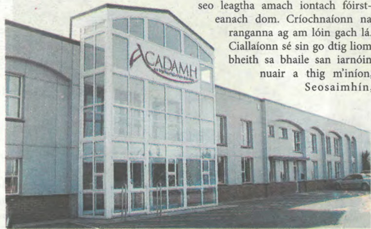
Acadamh na hOllscolaíochta Gaeilge, Gaoth Dobhair.