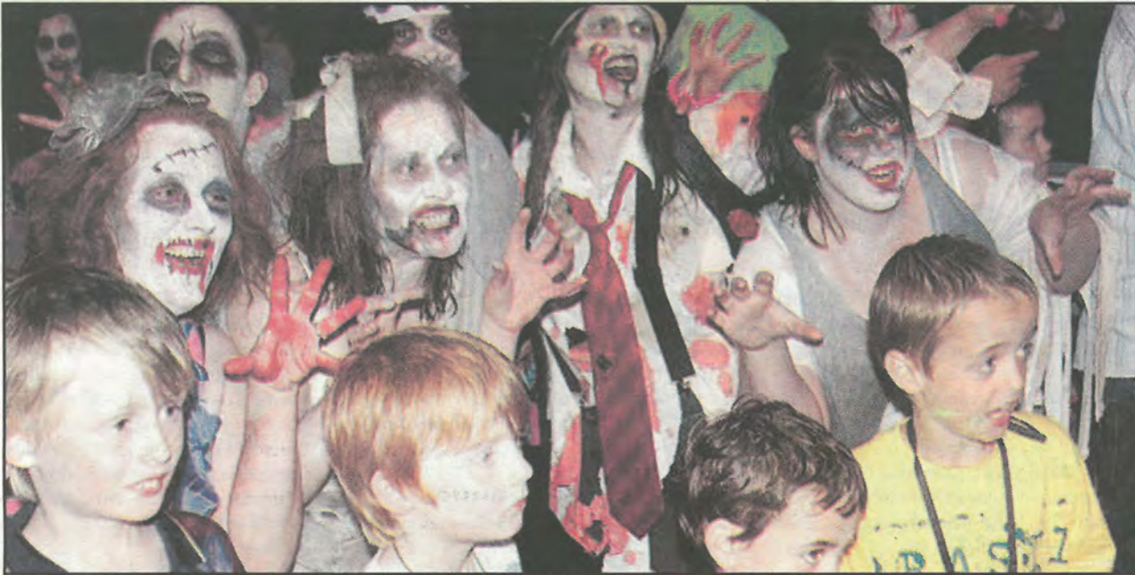
Uafás ar an Fhál Charrach: Cuid den lucht féachana ag an oíche a heagraíodh ar son Háití ar na mallaibh.

Cuireann Goitse fáilte roimh chomhfhreagras ag an seoladh riomhphoist goitsenuacht@gmail.com