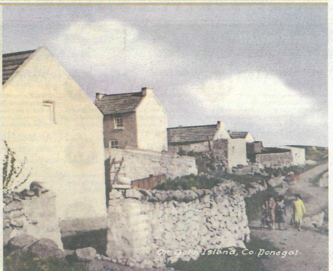
at Oola Island, Co. Donegal.