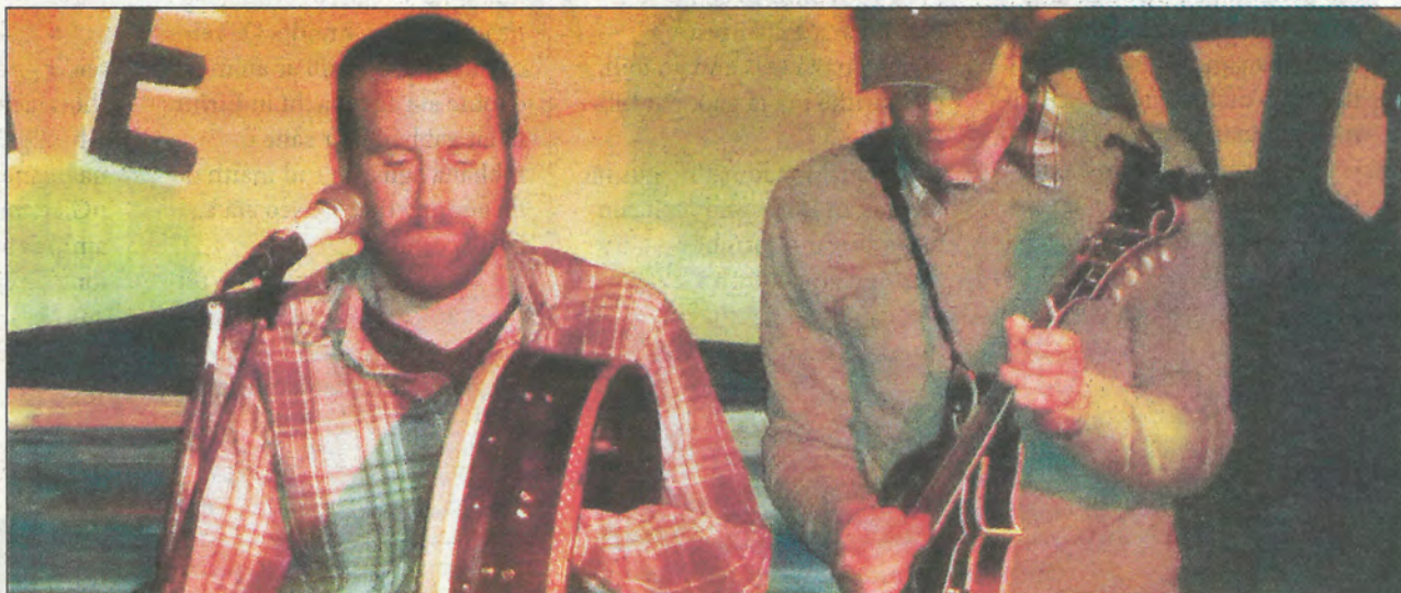
Baill den ghrúpa Na McGetigans ag bualadh ceoil ag an Cabaret Craiceáilte i nGaoth Dobhair ar na mallaibh