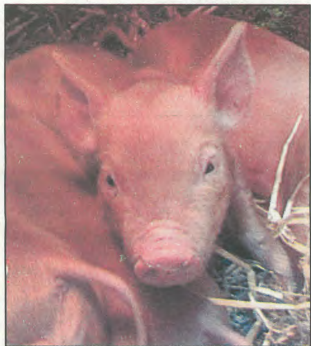
Tá na bainbh istigh sna stáblaí faoi láthair agus caitheann siad an lá ag rith thart sa chló.

Tá a fhios agam go bhfuil cuma dhoiligh ar an oideas seo agus go nglacann se go leor ama, ach le bheith fíréanta, nil se ar chor ar bith deacair; thig leat imeacht agus é a fhágáil fhad is atá an mascán istigh sa reoiteoir.