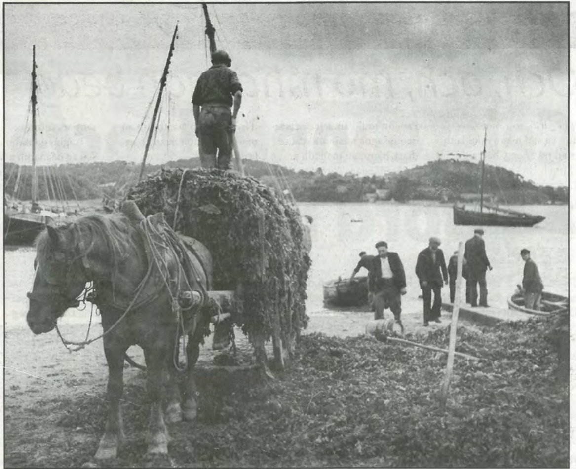
Grianghraif ón bhailúcháin staire áitiúil atá lke feiceáil mar chuid de thaispeántas sa Chrannóg i nGaoth Dobhair. Eolas: Comharchumann Forbartha Ghaoth Dobhair ag (074) 9532208.