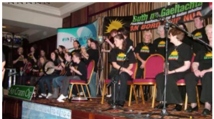
Cór Thaobh a' Leithid agus An Crann Óg ag an seoladh.