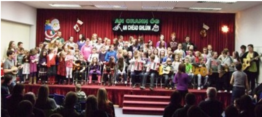
Taispeántas óna Ranganna Ceoil in Acadamh na hOllscolaíochta Gaeilge