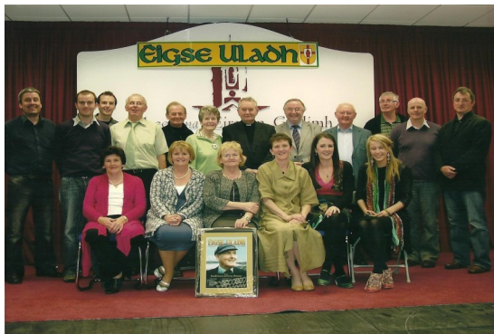
Ag foscladh na hÉigse