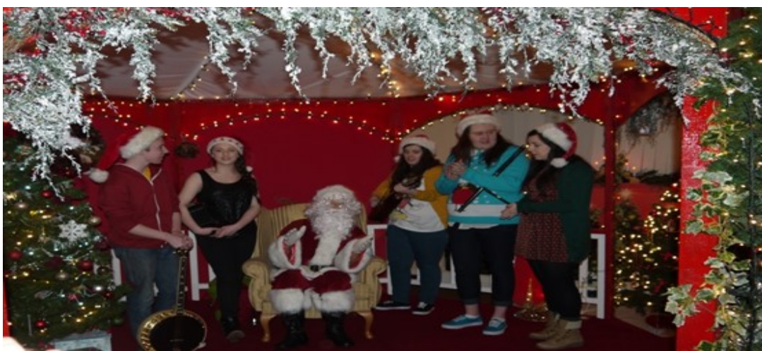
Cúpla port ceoil do Santa i ndiaidh lá cruaidh oibre