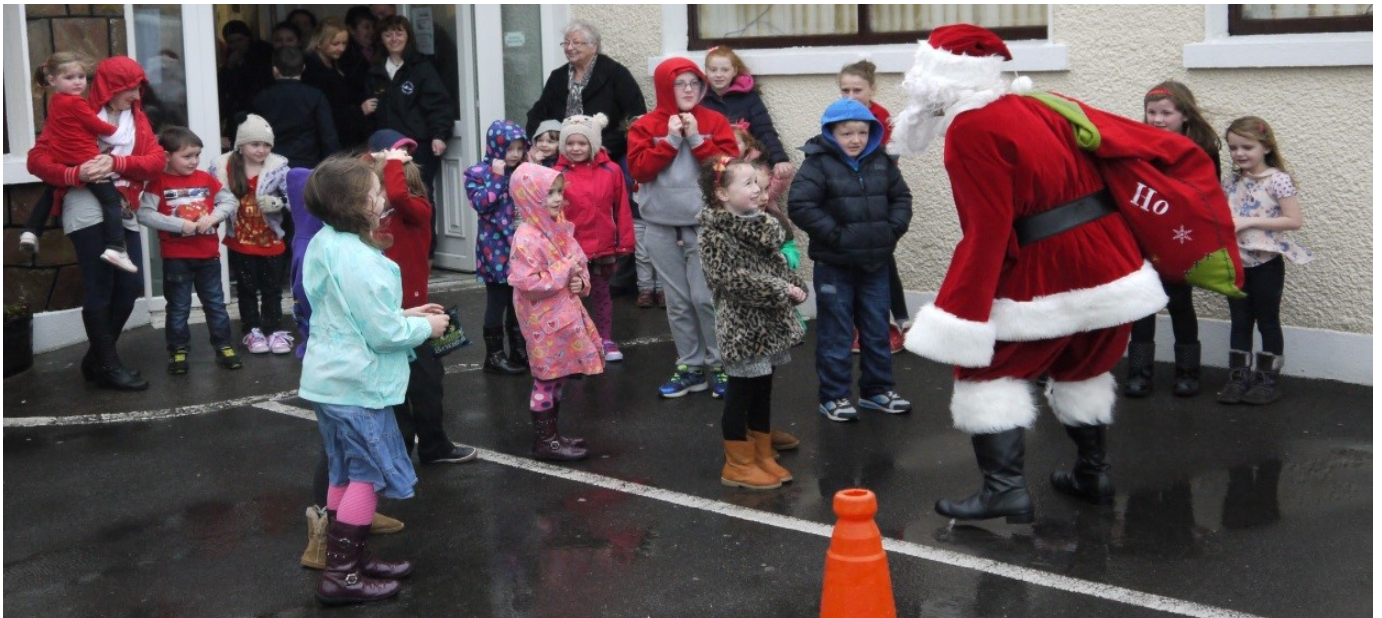
Fliuch agus eile tá Fáilte roimh Santa

Arís i mbliana bhí lá mór teaghlaigh sa Chrannóg ar an 14ú lá de Nollaig. Lá fuar, fliuch, gaofar a bhí ann ach níor stad sin Daidí na Nollag ó theacht ar chuairt chuig na páistí sa Chrannóg. Bhí rogha mhór d'earraí le díol ar an lá chomh maith. Bhí thar 170 páiste i láthair. Tógadh €1037 a rachas chun sochair do Ionad Lae Ghaoth Dobhair. Míle buíochas daofa sin uilig a thug cuidiú agus tacaíocht ar dhóigh ar bith, don lá.