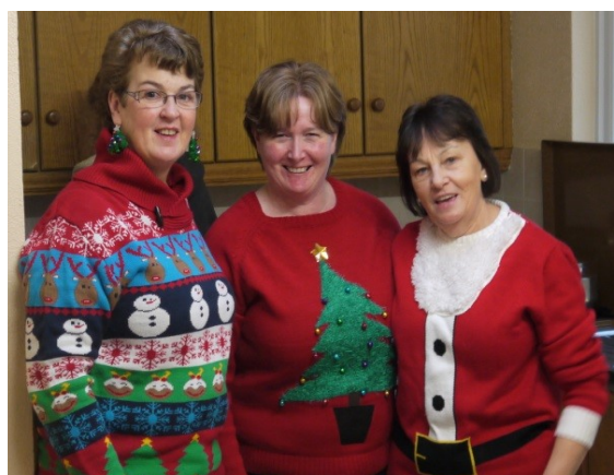
Mná an tae!!