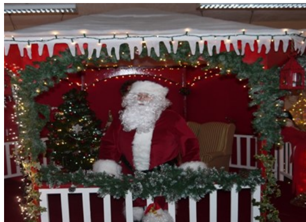
Santa ina 'gazebo' draíochtúil