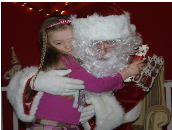
Croí isteach ó Dhaidí na Nollaig