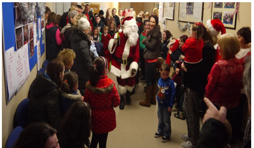
Fáilte mhór roimh Santa óna Mamaí chomh maith!