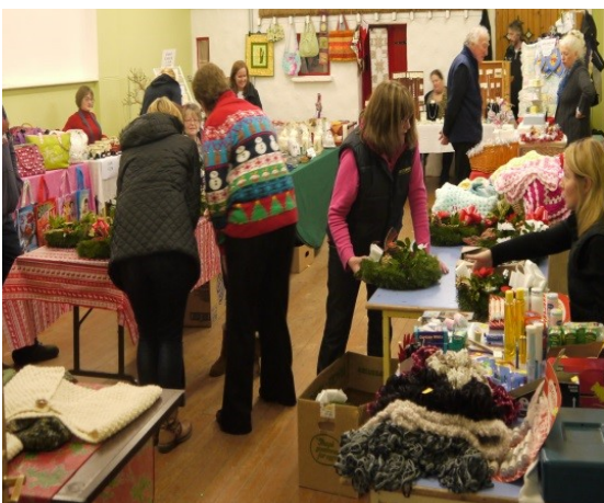
Roinnt de na h-earraí a bhí ar díol ar an lá