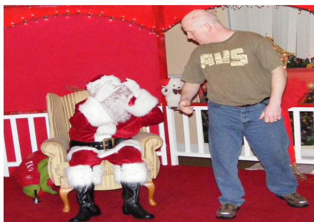
Tá Cathal ar an liosta dána!