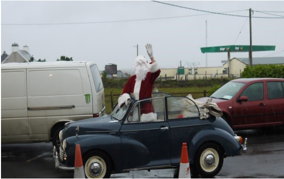
Santa sa 'Morris Minor' glas!!

Arís i mbliana bhí lá mór teaghlaigh sa Chrannóg ar an 14ú lá de Nollaig. Lá fuar, fliuch, gaofar a bhí ann ach níor stad sin Daidí na Nollag ó theacht ar chuairt chuig na páistí sa Chrannóg. Bhí rogha mhór d'earraí le díol ar an lá chomh maith. Bhí thar 170 páiste i láthair. Tógadh €1037 a rachas chun sochair do Ionad Lae Ghaoth Dobhair. Míle buíochas daofa sin uilig a thug cuidiú agus tacaíocht ar dhóigh ar bith, don lá.