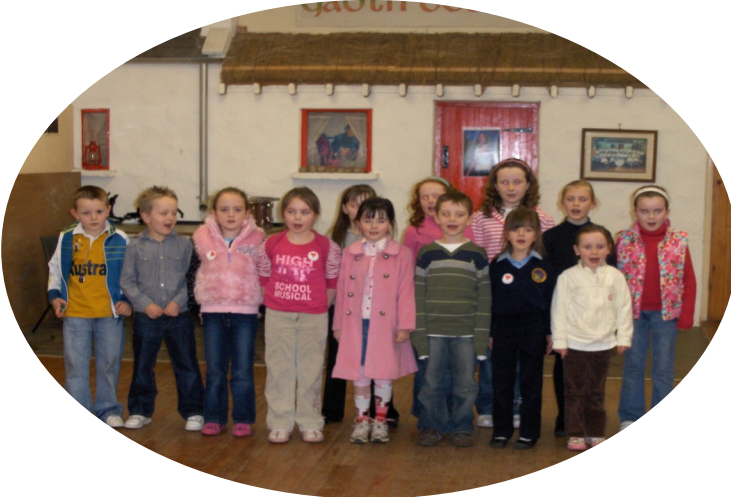
Cuid de na páistí a ghlac páirt