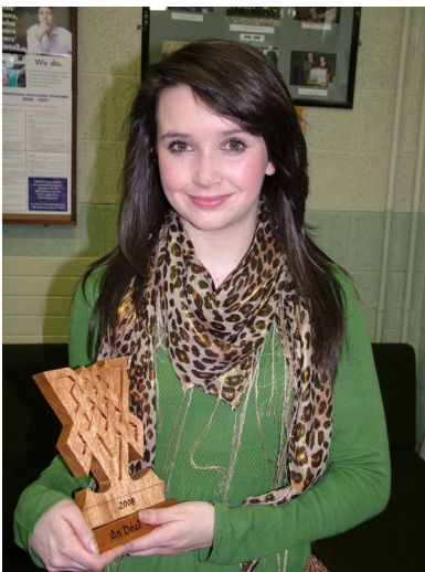
Brídín Ní Mhaoldomhnaigh Dán Nua chumtha