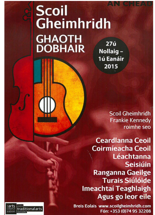
An Crann Óg ag seoladh Scoil Gheimhridh Ghaoth Dobhair i gColáiste Phádraig, Drom Conrach ar an 11ú Samhain