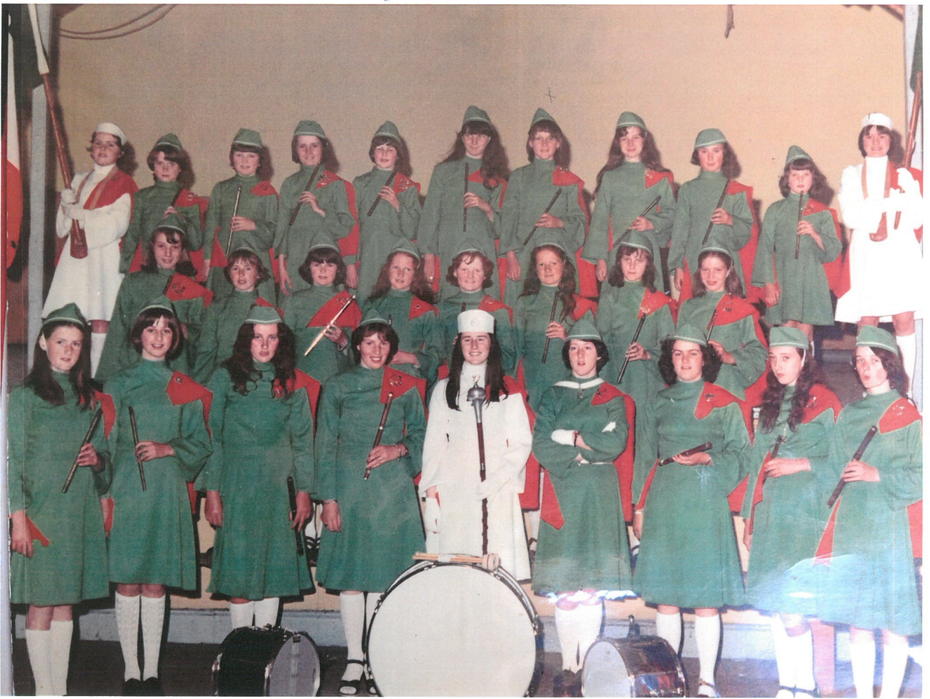
Bannaí Ceoil Dhoirí Beaga Cén bhliain agus cé iad fhéin?