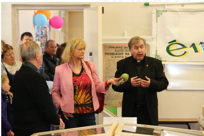
An tAthair Ó Baoighill ag caint