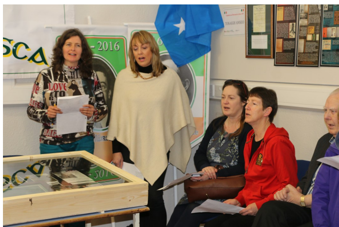
Na mná ceoil