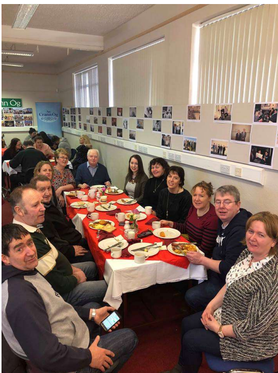
Foireann na Crannóige