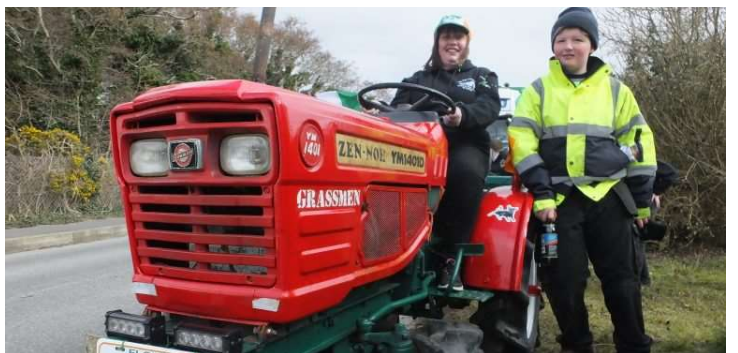
Club Óige Chnoc Fola