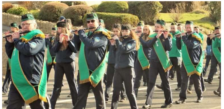
Na Bannaí Ceoil