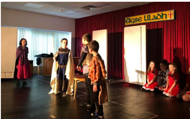
Tairseach an tSeanchais

Comhghairdeas leo uilig as an obair chrua.