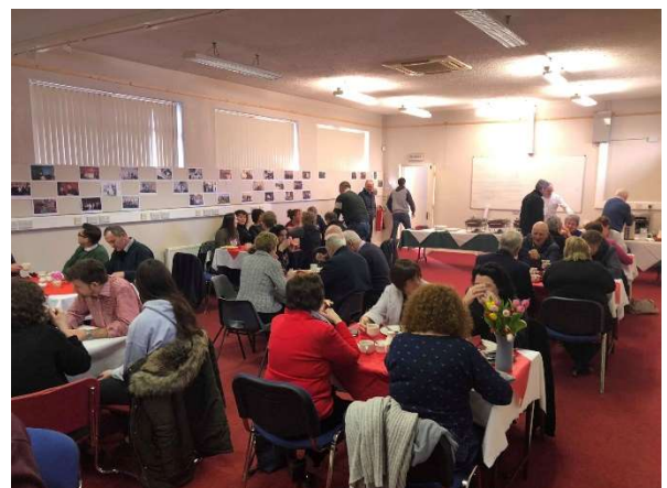
Ag baint sult as an bhricfeasta