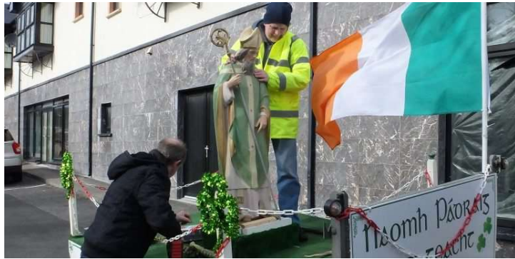
Ag deánamh reidh