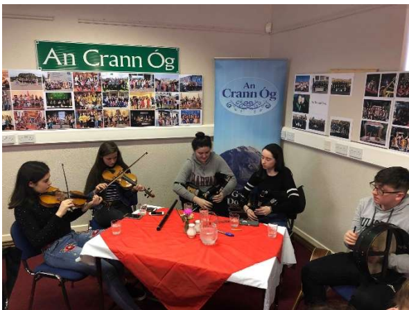
An Crann Óg i mbun ceoil

Bhí bricfeasta sa Chrannóg ar an 9ú Márta le 30 Bliain den Chomharchumann a Cheiliúradh. Deis a bhí ann fosta don phobal theacht isteach agus am a chaitheamh le coiste agus foireann an Chomharchumann.