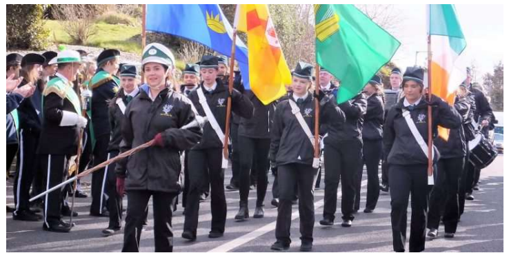
Banna Ceoil Óige na Crannóige