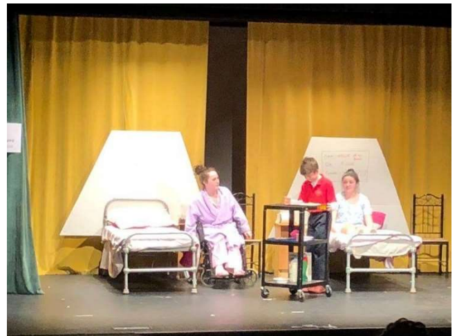
B & B an HSE