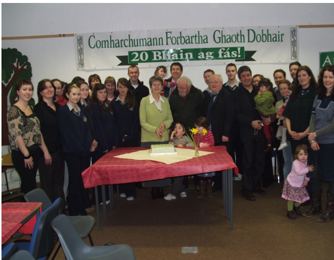
Ceiliúradh 20 bliain an Chomharchumainn