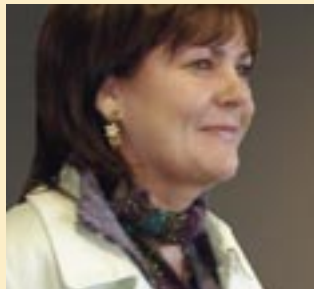
Gradam d'Áine Ní Fhoghlú

'Roghnaigh an coiste measúnóireachta an leabhar seo as a cheardúlacht agus as a chuid fileatachta. Is é a chuaigh i bhfeidhm orthu an tuiscint ghlinn