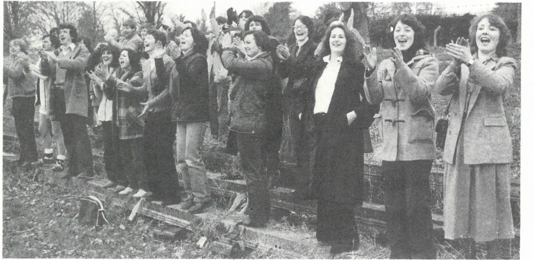
• Cuid den slua ag tabhairt tacaíocht d’fhoireann an Údarás.