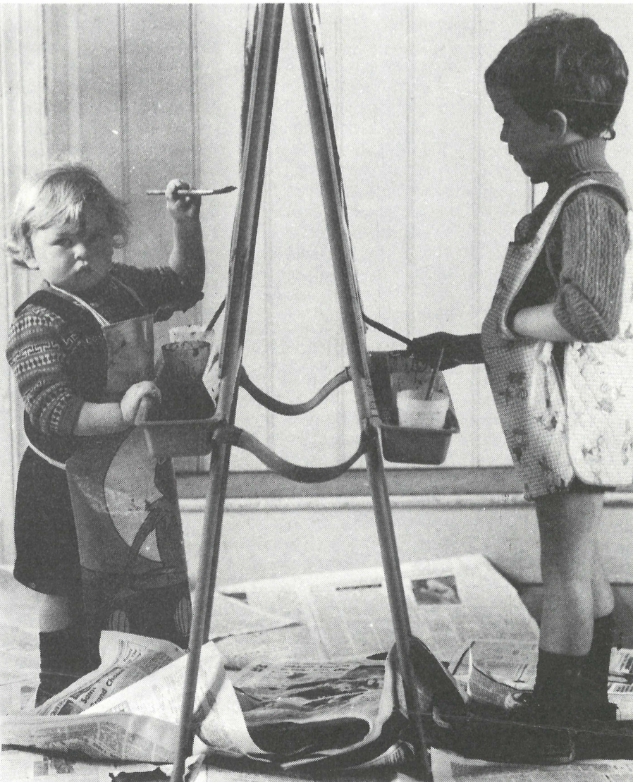
Ná bí ag cur isteach ar an obair a mhac! - Naíscóil Dhún Chaoin.

IS MINIC a tharlaíonn, go háirithe ins na hEolaíochtaí mar shampla, go mbíonn an smaoineamh maith céanna ag daoine i ngan fhios dá chéile b'fhéidir, agus go minic neamhspleách ar a chéile. Ní hionadh mar sin gur tharla tuiscint ar thábhacht na náiscolaíochta ag an am chéanna ag Gaeltarra (mar a bhí), ag an gComhdháil agus ag an gConradh a chuidigh tús a chur leis an eagraíocht le cabhair airgid ó Bhord na Gaeilge, déanadh comhordnú idir roinnt de na hiarrachtaí seo tríd an gComhchoiste Réamhscolaíochta.