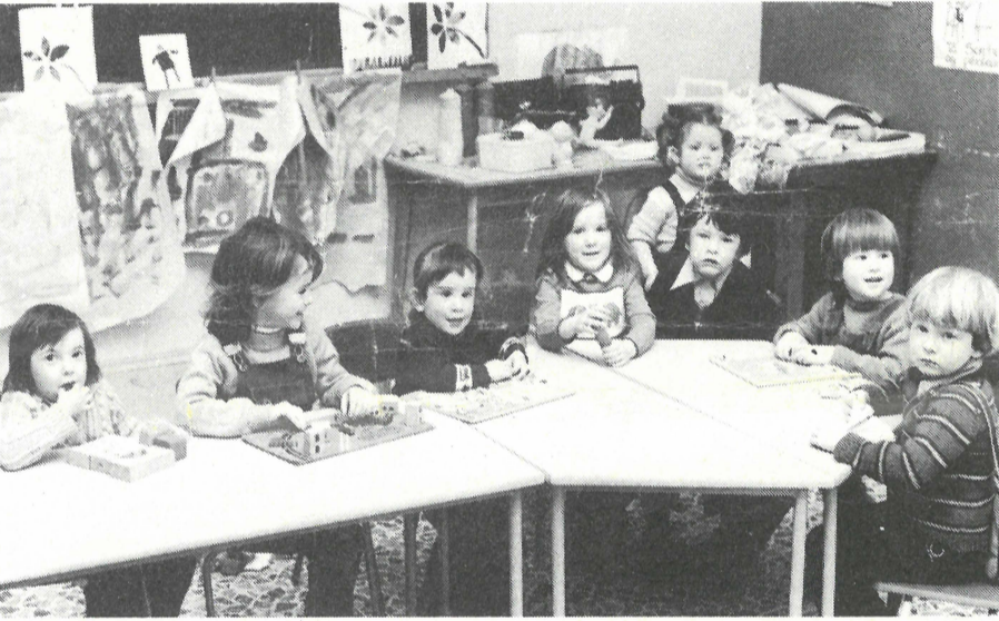
Saol sona sásta i Naíscóil Chois Fharráige - Pictiúr le Jimmy Walshe.

le Helen Bean Uí Mhurchú Cathaoirleach an Comhchoiste Réamhscolaíochta.