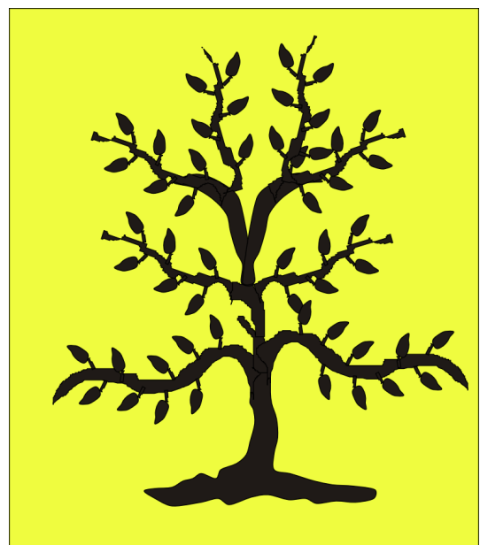
An Crann Ginealaigh