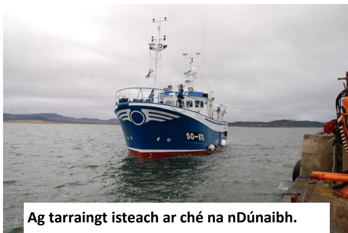
Ag tarraingt isteach ar ché na nDúnaibh.

Ní raibh a dhath le cloisteáil le roinnt blianta anuas ach 'géarchéim' agus 'ciorraithe' agus 'gearradh siar' agus 'ganntanas' agus 'páirt-aimseartha' agus dólás, gruaim agus amhras in achan áit a d'amharcfá. Ach ansin tchím an ghrian ag gobadh amach fríd na néalta dorcha, an lagsprid ag trá agus agus dólás a bhriseadh? Caidé faoi a bhfuil mé ag tagairt? Tá mé ag tagairt den Amy Jane 11, bád úr Chomhlacht Mhic Giolla Bhríde a shroich céidh na nDúnaibh ar na mallaibh. Is breá an soitheach é, 20 méadar ar fhad agus é péinteáilte gorm agus geal bán san úras.