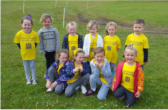
Tír na nÓg 1