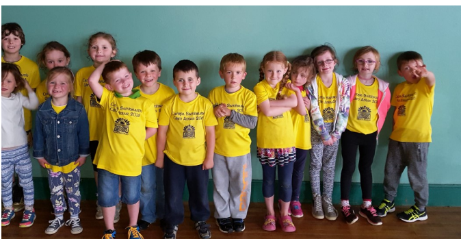
Tír na nÓg 2

Déanamh Poitín i nDún na nGall sa chéad leath den 19ú aois.