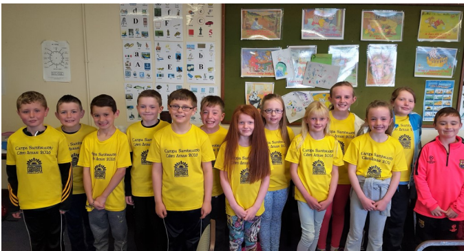
An grúpa meánaosta !