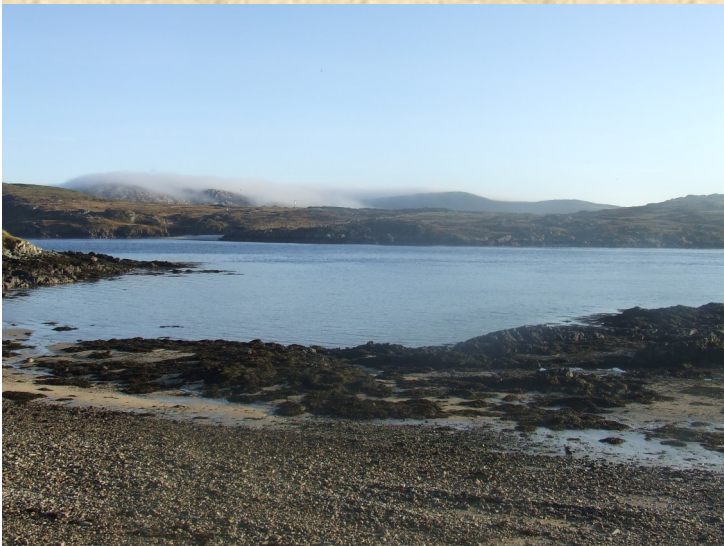
Bá Dhún Duain