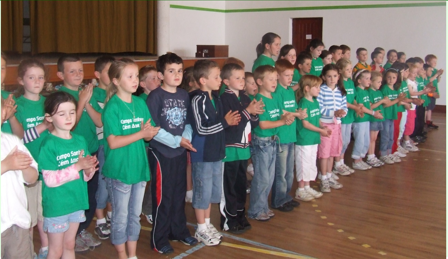
Campa Samhraidh 2007

Seo an ceathrú bliain as a chéile a reáchtáil Céim Aniar Campa Samhraidh do pháistí in Ionad C.L.G. na nDúnaibh agus mar atá le feiceáil ó na grianghraif bhí muid ámharach leis an aimsir arís i mbliana. Socraíodh go mbeadh campa amháin