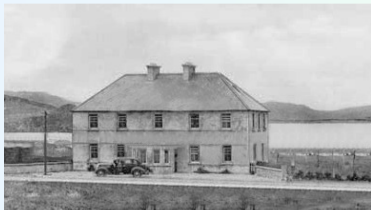
Óstlann na Trá