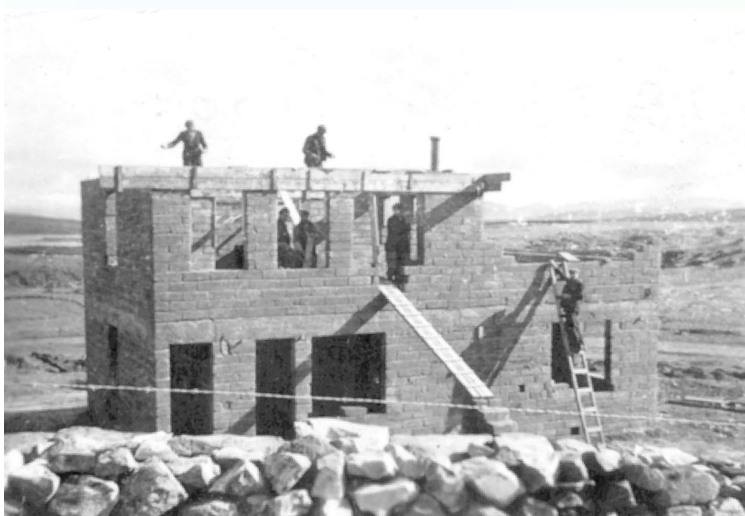
Ag tógáil an tí sa bhliain 1950.