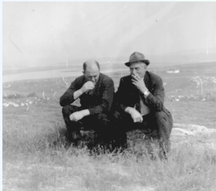
Paidí Mhici agus Mosie Mac Giolla Shionnaigh

Curtha le chéile ag Aodh Mac Laifearthaigh.