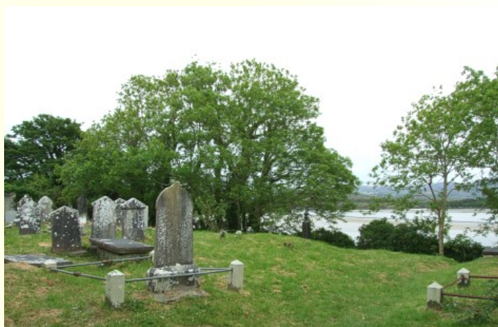
An Reilig ag Caisleán na dTuath