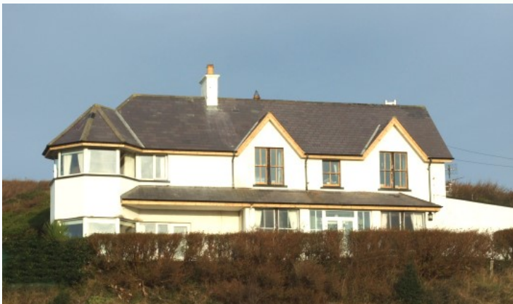
Teach Cheann na Leargaidh