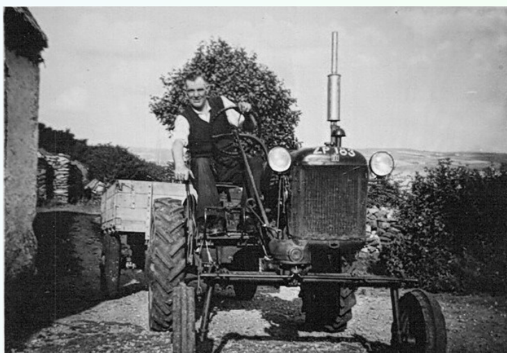
Den ar an "cub"

Ní raibh bean sa pharóiste a d'oibrigh comh dícheallach ar fheirm agus a rinne Cassie, ní raibh aon ghné den obair fheirme nach raibh lámh aici ann agus ba í a bhíodh na ba uilig. Agus cé go mbíodh sí de shíor ag obair bhíodh