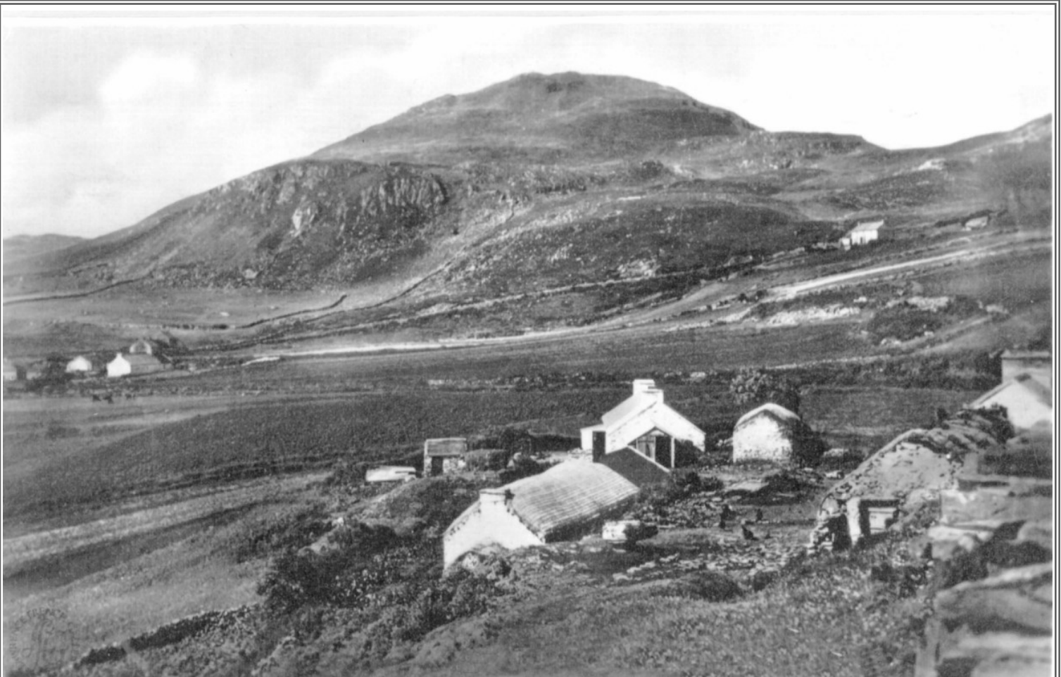
Gáinne ó Chluain tSaileach sa tSean-am.