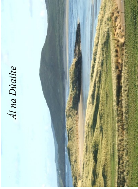
Ál na Dúailte