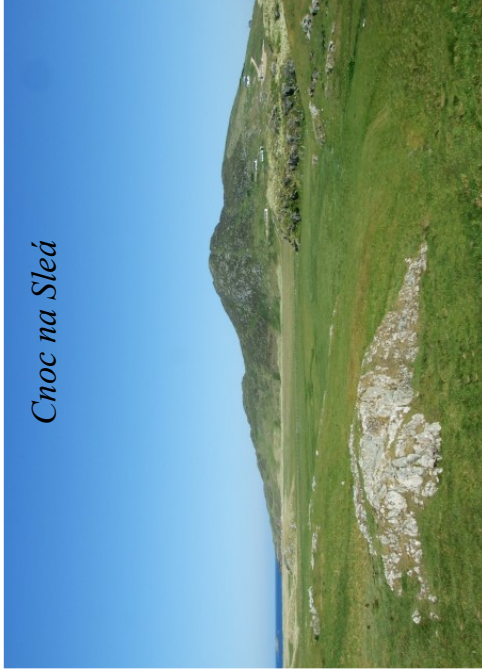
Cnoc na Sleá