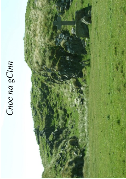
Cnoc na gCinn