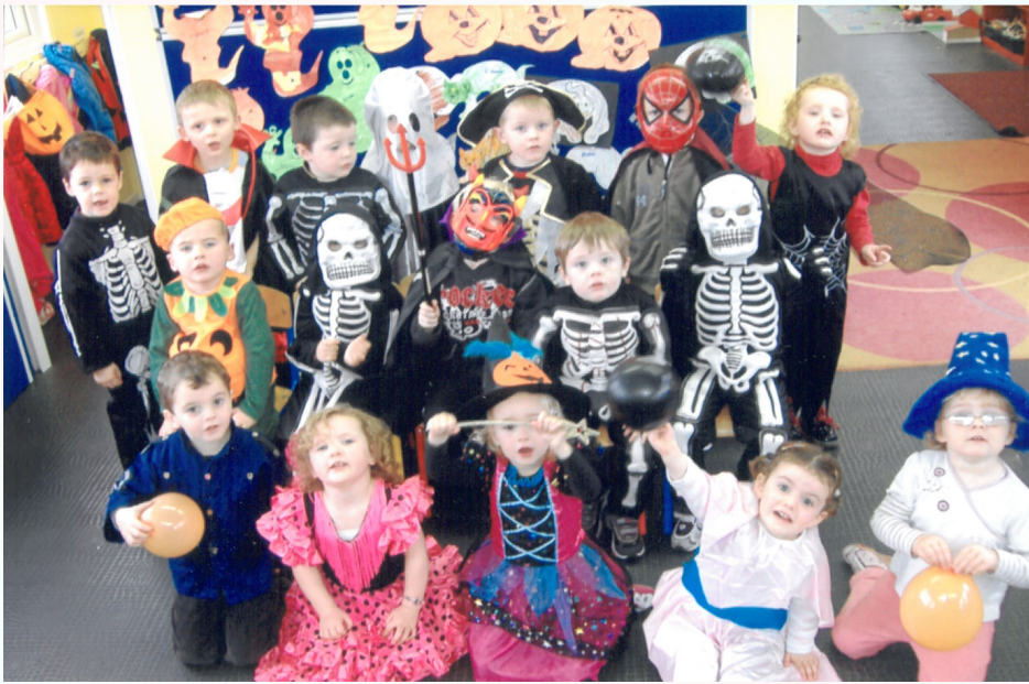
Ag ceiliúradh Oíche Shamhna i Naíonra Dhuibhlinn Riabhach.