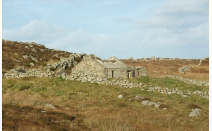
Seanbhallóg na Spiairí