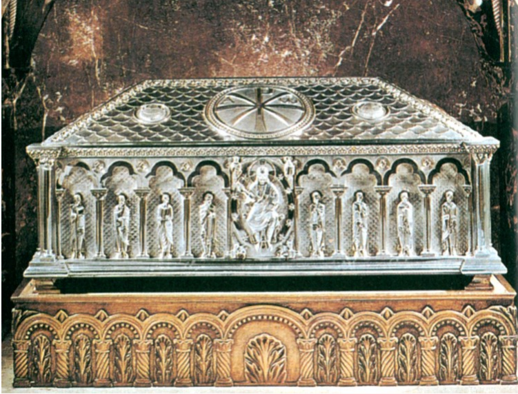
An bosca airgid ina bhfuil taisí Naomh Séamas

dhealbh Naomh Séamas agus ar an bhosca airgid ina bhfuil na taisí is mó a bhíonn tarraingt. Thig leat siúl thart ar chúl na deilbhe agus do phaidir a chogar ina chluais, agus siúl thart leis an bhosca luachmhar. Bíonn manach ina shuí in aice leis i gcónaí.