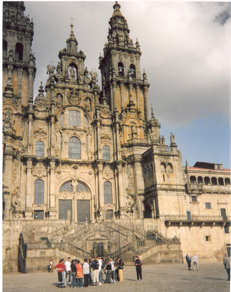
Ardeaglais Santiago de Compostela