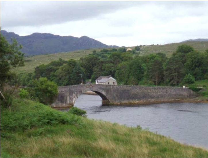
Droichead an Leacaigh