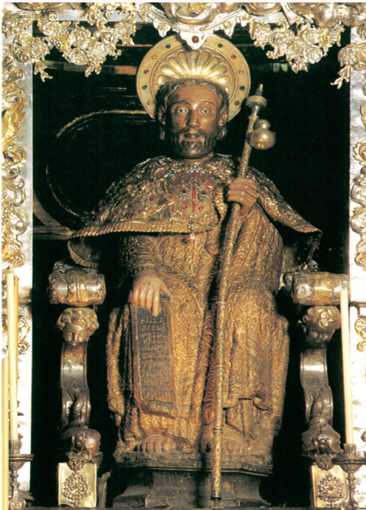
Dealbh Naomh Séamas

Tá an Ardeaglais thar a bheith suimiúil, agus is ar