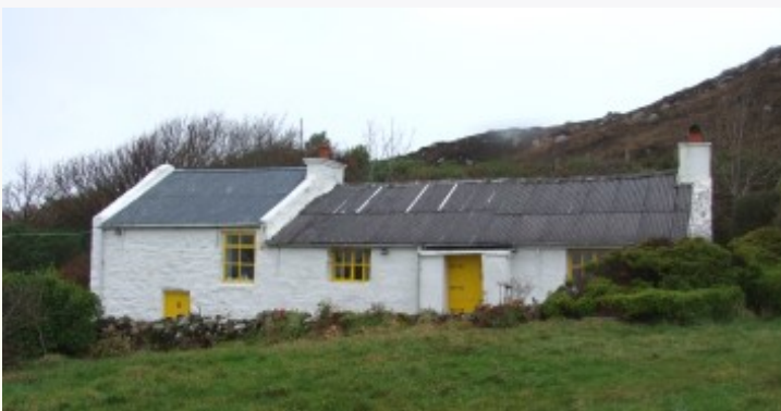
Teach Nan i mBaile an tSléibhe

d'éirt sí fíin, bhí sí mar a bheadh ríúsán ann. Bhí sí in ainm a bheith naofa ach bhí sí creathnach gíar. Bó