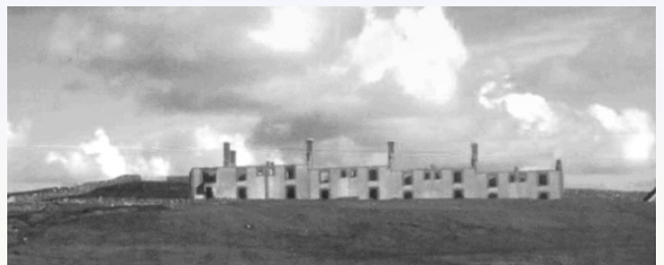
Ballóga Stáisiún an Gharda Cósta