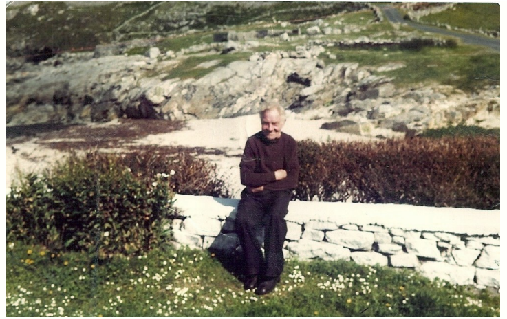
Neaty Phádraig Den

Choinnigh siad teach néata, slachtmhar agus bhí urlár deas de leacacha sa chistin agus tine oscailte den tseandéanamh ann. Ceann de na rudaí a ba ghnách a bheith i gcuid mhór tithe san am sin ná seilf os cionn na tineadh agus bhíodh a lán ornáidí beaga deasa ina shuí orthu. Bhí a mha-casamhail tí Den.