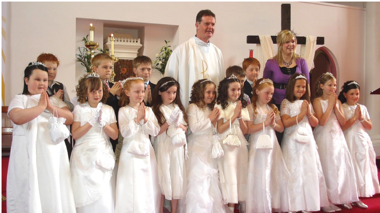
Scoil Naomh Bríd, na Dúnaibh.