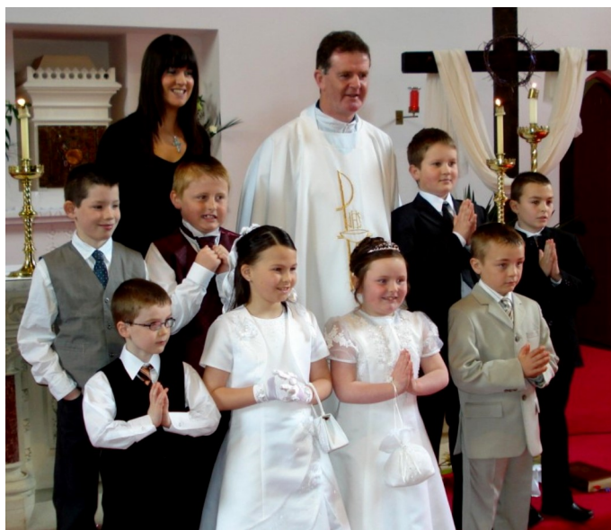
Scoil Eoin Baiste, Carraig Airt.