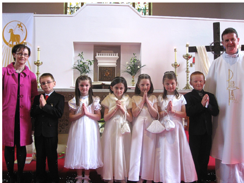
Scoil Cholmcille, Duibhlinn Riabhach