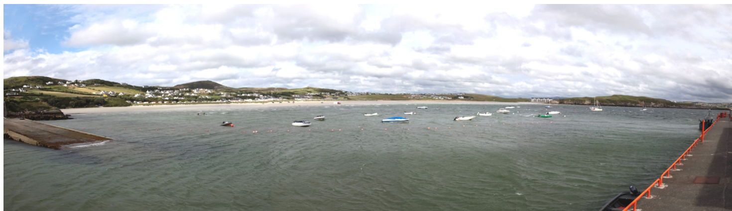
Seo pictiúr de na Dúnaibh ón ché, a ghlac an grianghrafadóir Derek Prescott a bhí anseo le muintir na hAlban an tseachtain is a chuaigh thart.