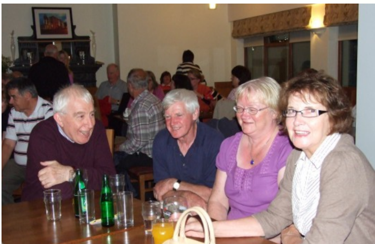
Ag an cheolchoirm in Óstán na Trá

Ach oíche Mháirt is a chuaigh thart tháinig dream a theann an dlúth-cheangal eadrainn níos mó ná rinne iascaireacht nó peil, ‘s iad sin dream ceoltóirí as Albain