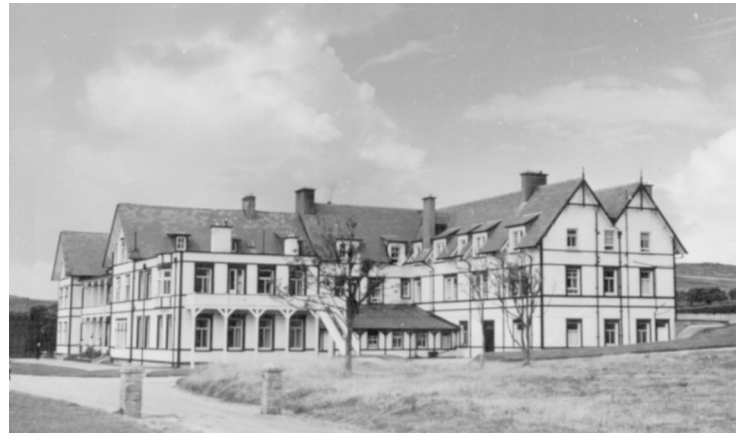
Seanóstán Ros na Binne