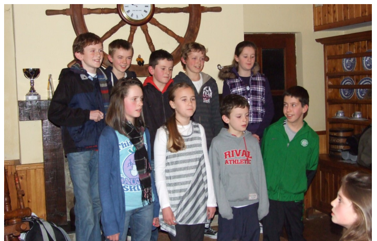
Rang 5 & 6