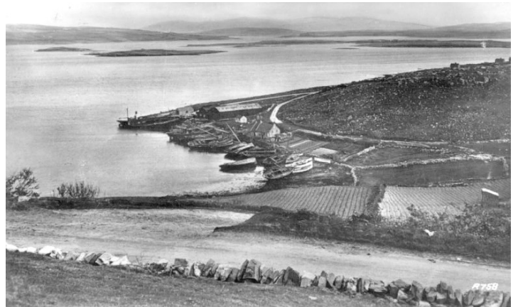
Lag na hUillinne