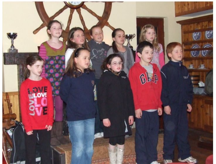
Rang 3 & 4