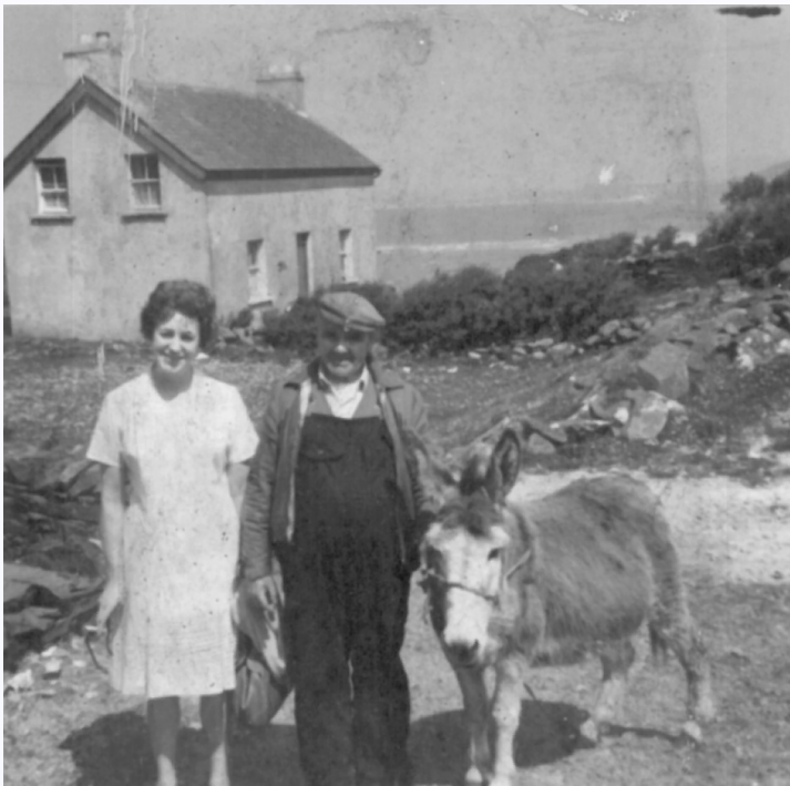
Den Óg ag seanteach Ghréasaí ar an Ghlíob

Ba Den Mac Giolla Bhríde nó Den Óg mar ab fhearr aithne air agus a bhean Bidí Nic Giolla Bhríde, Bidí 'n Ghréasaí as an Ghlíob na tionóntaithe a chuaigh isteach sa chéad teach,