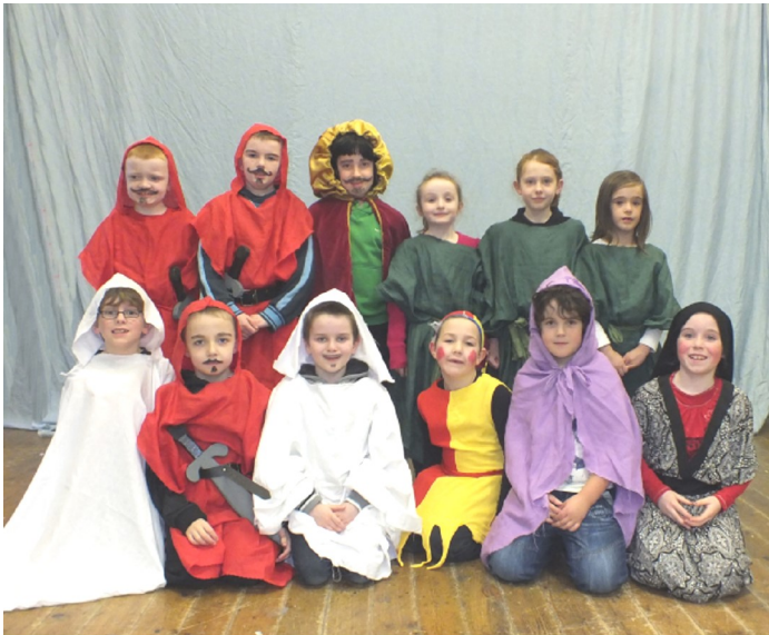
Rang 1 & 2