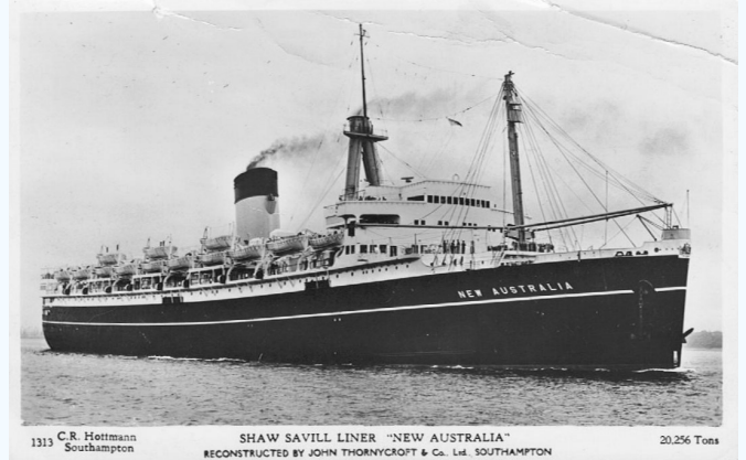
SHAW SAVILL LINER "NEW AUSTRALIA" RECONSTRUCTED BY JOHN THORNYCROFT & Co. Ltd. SOUTHAMPTON 20,256 Tons