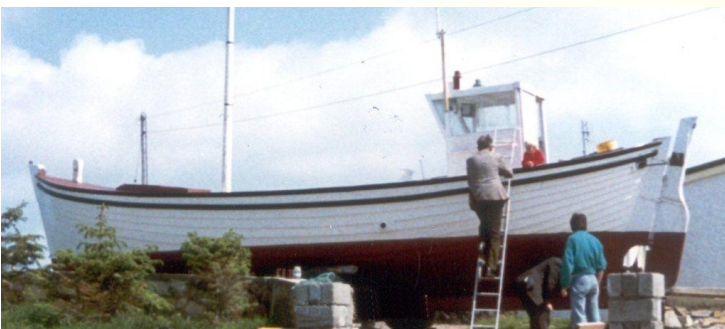
Ag obair ar an bhád "Maighre na Mara"

Bhí na chéad bhádaí a tógadh ag Lag na hUillinne ina amsan leathchéad troigh ar fhad agus ansin tosaíodh ar bhádaí a thógáil a bhí sé troighe dé-ag agus daichead. Nuair a thosaigh sé mar phrintíseach cha raibh aige de pháighe ach na seacht scilling déag agus sé pingne agus ardú de leathchoróin, agus ansin de choróin le linn na mblianta go dtí gur cháiligh sé. Nuair a bhí sé cáilithe mar shaor báid bhí sé ag saothrú seacht bpunta sa tseachtain. Dúirt sé go raibh a chroí istigh sa tslí beatha a roghnaigh sé agus bhí a shliocht air mar gur fhág sé lorg a láimhe ar os cionn fiche leath-decker a thóg sé ag a bhádchlós fhéin, bádaí a rinne iascaireacht amach as achan phort agus achan oileán ar chósta Dhún na nGall. Níl seo ag cur san áireamh na bádaí a tógadh i mbádchlós Mhíobhaigh na blianta a chaith sé ansin ó 1949 go 1963. Lena chois sin chaith sé cúpla bliain ag tógáil bád i Ramhros le Neití Mac Lائفartaigh sular thosaigh sé a dtógáil in aice lena theach fhéin i 1971. Caithfear cur san áireamh fosta gur thóg sé bádaí beaga agus gur chuir sé bail ar bhádaí. Tá cuimhne aige go fóill ar an chéad leath-decker a thóg sé 1971, an Girl Aifric, bád a thóg