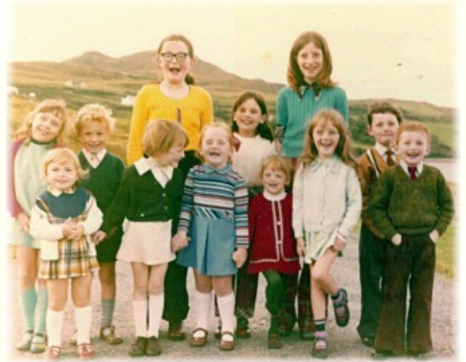
Cóisir Lá Breithe i Ros na Binne