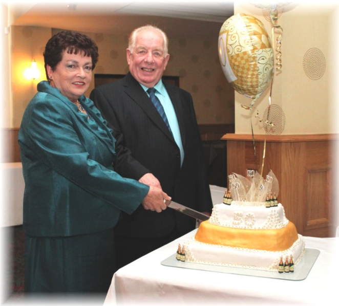
Ag ceiliúradh 50 bliain pósta