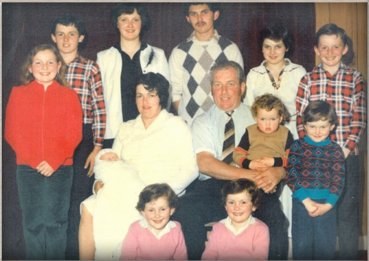
Clann Uí Shibhleáin