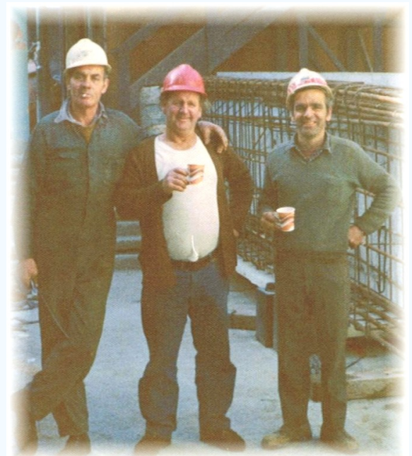
Ag obair ar na suíomhanna.