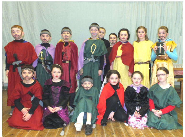
Rang 3 & 4