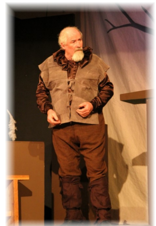
An Tiarna Talún

Thug na cuairteoirí moladh mór d’áilleacht an cheantair agus do chairdiúlacht agus do fhlaithiúlacht mhuintir na háite agus ba mhaith linn ár mbuiochas a ghabháil le ach an duine a chuidigh le Céim Aniar le linn na Féile agus do bhunadh an cheantair a chur fearadh na fáilte roimh ár gcuariteoirí.