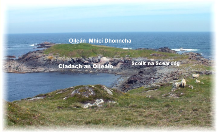
Scoil na Sceardóg