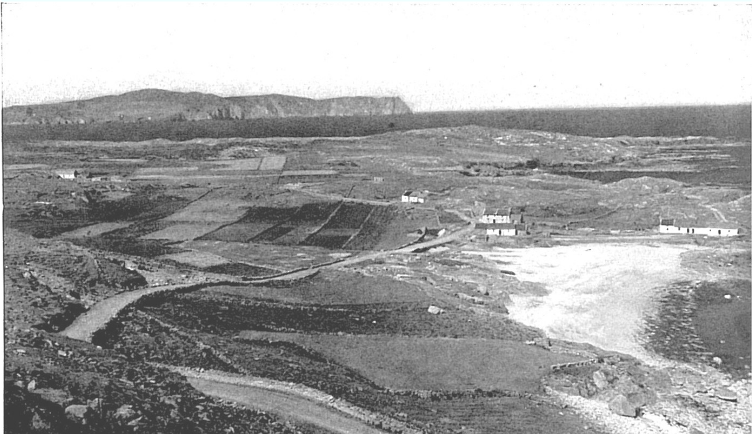
Seo thuas pictiúr de Dhumhaigh a bhí sa leabhar seo a foilsíodh don chéad uair sa bhliain 1937

Anois, nár cheart dúinn a bheith bródúil as ár gceantar féin?