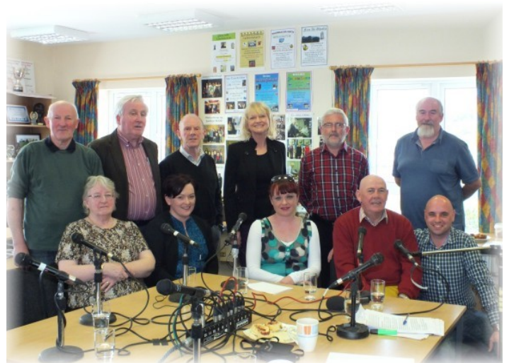
An clár “Barrscéalta” a craoladh beo ó oifig Céim Aniar.