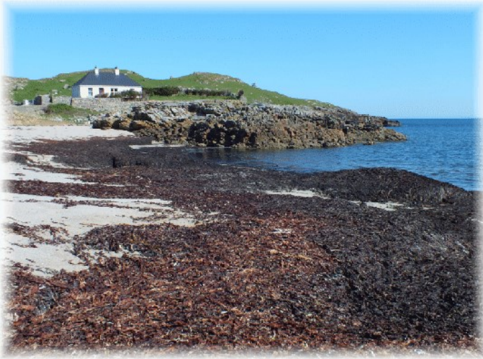
Trá Dhumhaigh i ndiaidh an Scoith Bhuí

Sin an t-ainm atá ar an stoirm a tharlaíonn idir an deichiú lá agus an ceathrú lá déag de mhí na Bealtaine achan bhliain. Bíonn daoine ag feitheamh ar an scoith bhuí teacht agus ag dúil le farraige throm agus aimsir gharbh teacht leis. Deirtear gur drochchomhartha aimsire é muna dtagann sé san am cheart.