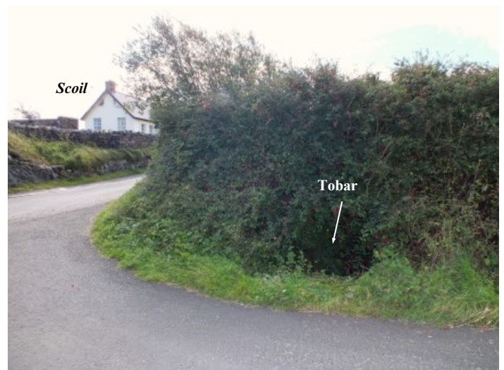
An Tobar atá deas do sheanscoil Mhíobhaigh