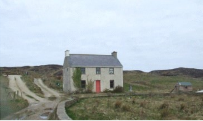
Teach a' Mhaistir