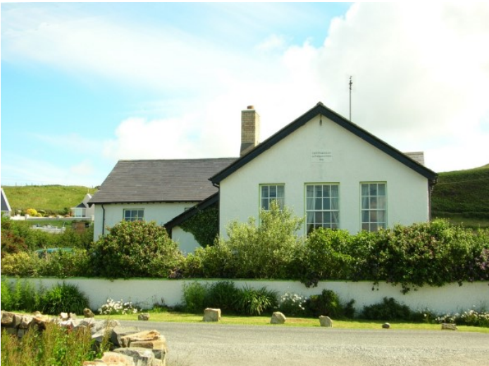
Scoil Dhoire a'Chasáin