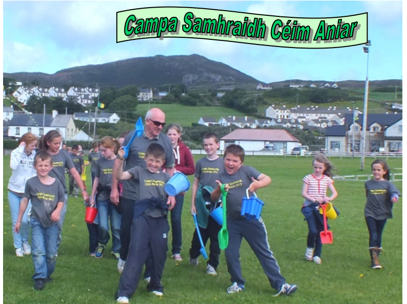
Ag dul go dtí an trá