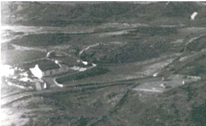
Teach Aindi Rua i gCluain tSaileach

Ba iad Dónall Ghráinne as Cluain tSaileach