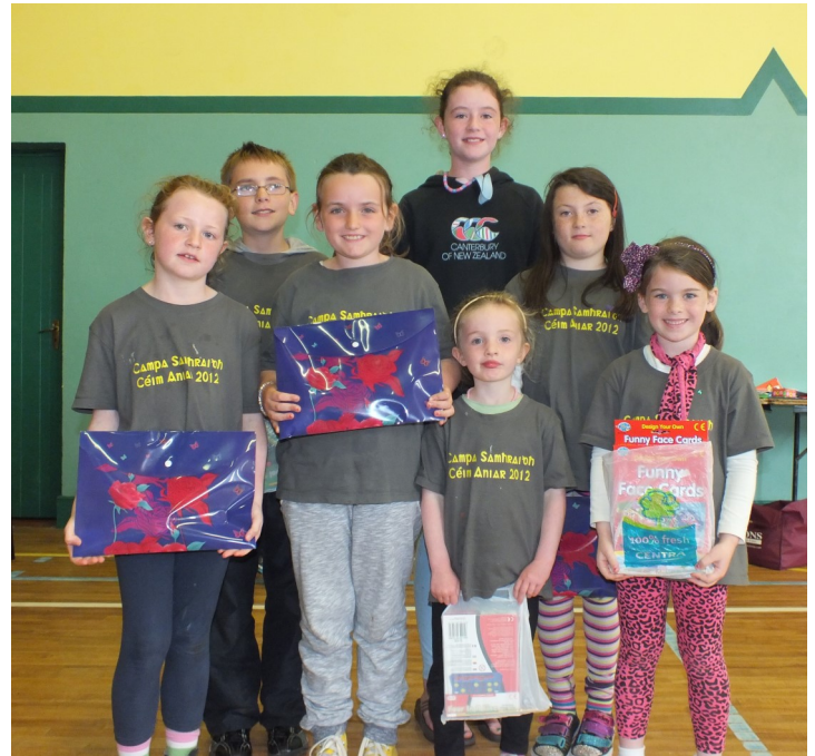
Buaiteoirí na nduaiseanna ar an champa i mí Iúil.

D'éirigh go maith leis an dá champa samhraidh a bhí a reáchtáil ag Céim Aniar i mbliana. Bhí imeachtaí éagsúla ar siúl achan lá: cluichí spóirt, ealaíona agus ceardaíocht, cluichí intinne, damhsa, amhránaíocht, comórtais tógáil caisleáin ar an trá agus rud beag cócaireachta - rinne na páistí píotsaí agus bunóga brioscáin ríse. Chuir siad seó beag i láthair ag an deireadh agus bronnadh teastas ar na páistí uilig. Bronnadh duaiseanna ar na páistí a rinne is mó iarracht Gaeilge a labhairt an t-am ar fað. Ba mhaith linn ár mbuíochas a ghabháil leis na cúntóirí uilig a rinne jab iontach. Bhain na rannpháirtithe taitneamh as a gcuid ama ar an dá champa.