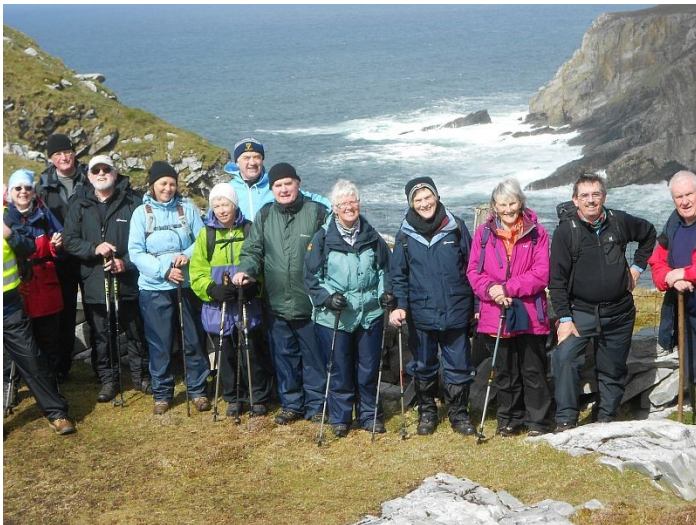
Na siúlóirí ar Chorrán Binne

Chaith siad lá suimiúil i bPáirc Náisiúnta