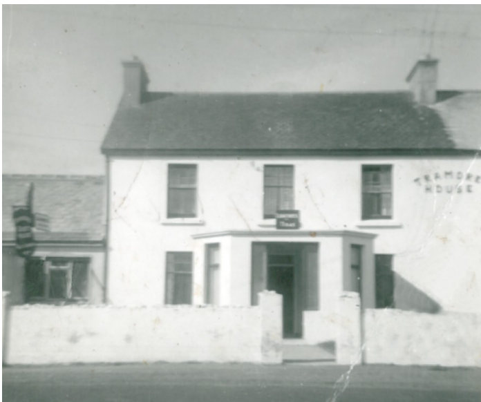
Teach Thrá Mór