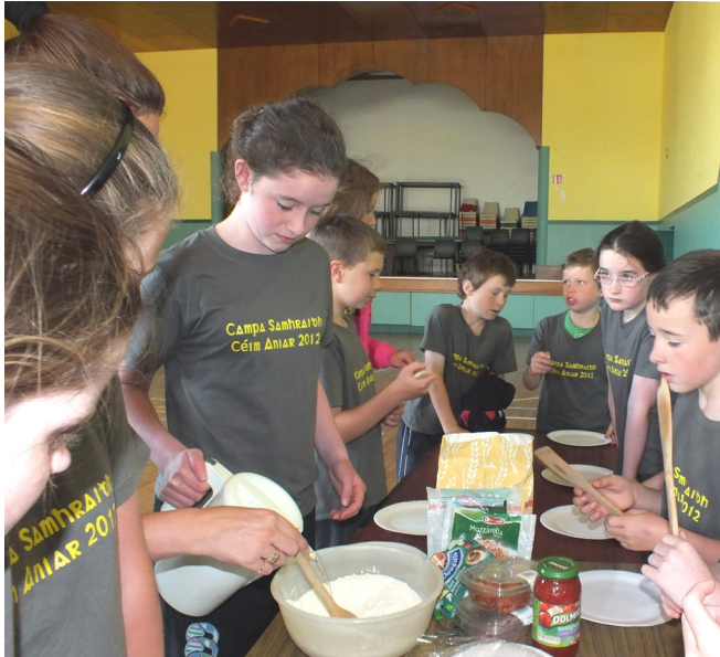
Ag déanamh piotsaí