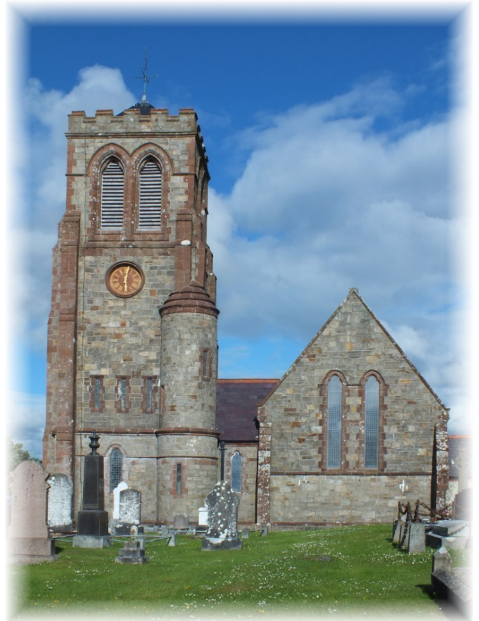
Eaglais na Trionóide Naofa i gCarraig Airt

Níl a fhios ag duine ar bith go cinnte agus cha bhíonn fhios a choíche caidé a tháinig den Prominent ach is cinnte go mbeidh a mbarúlacha fhéin ag cuid mhór daoine, mar a bhí ag an am,