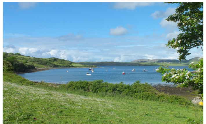
Lag na hUillinne

Ar an Sathairn an chéad lá de Feabhra bhí an Prominent agus cúpla drifter eile, an Radiant agus an Weal, ar ancaire ag Lag na hUillinne. Tráthnóna Dé Luain an tríú lá, i dtrátha an ceathair a chlog, d'fhág siad Lag na hUillinne le dhul sa tóir ar na scadán, an Radiant ar dtús, an Prominent 'na diaidh agus an Weal ansin. Bhí an aimsir go measartha, spéir ghlan agus an ghaoth aniar. Chuir an Prominent a cuid eangacha san fharrage