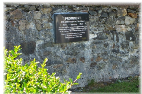
Go ndéana Dia trócaire orthu uilig

Ar an 6ú Feabhra a tháinig corp an mhadaidh i dtír agus d'aithin criú an Radiant é. Cuireadh é ar an chladach agus tugadh a choiléar ar ais go Burghead. Fuarthas beirt de na coirp ag tús mí Márta agus tá siad curtha in aice leis an bhalla i Reilig na Trionóide Naofa i gCarraig Airt. Dar ndóigh, de thairbhe na coirp a bheith an fhad sin san fharraige, cha raibh dóigh ar bith a dtiocfaí iad a aithint. Bhí coirp eile le feiceáil fá na carraigeacha fosta ach níodh amach 'na farraige iad sula bhfuarthas deis a dtabhairt i dtír. Is cinnte go raibh Burghead croíbhriste nuair a fuarthas scéala go raibh an bád cailte. De thairbhe na tubaiste seo fágadh seisear ban ina mbaintrí agus ocht bpáiste is fiche gan athair.