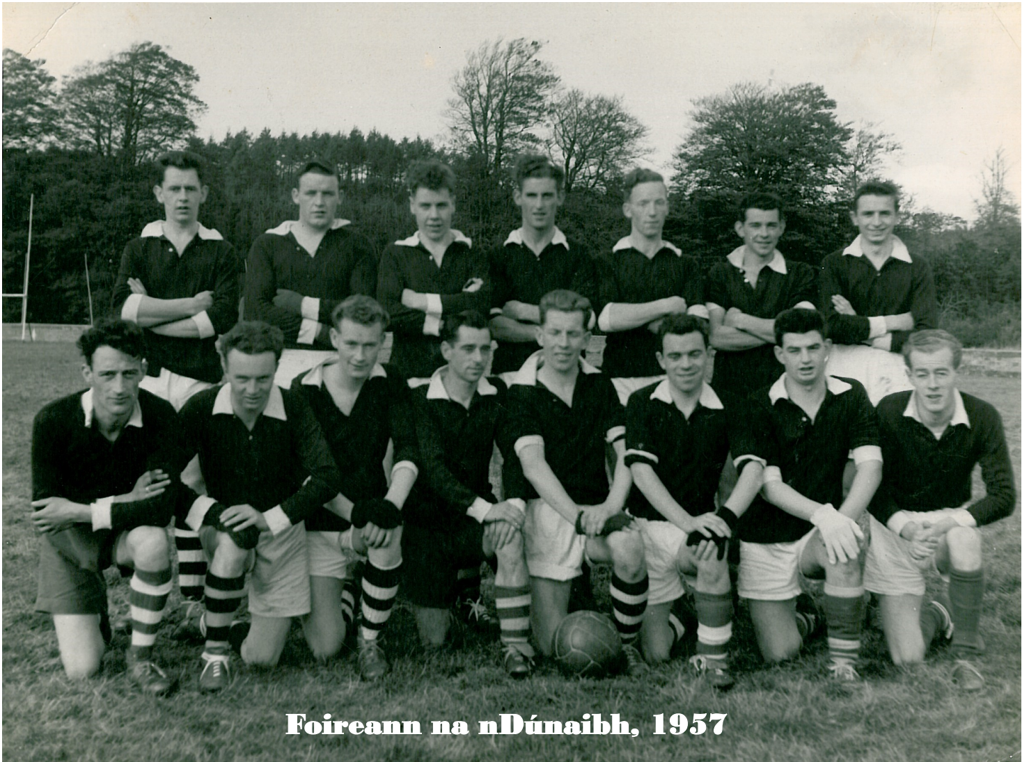
Foireann na nDúnaibh, 1957