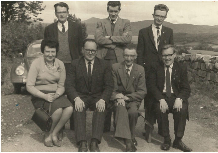
Coláiste Loch Súilí