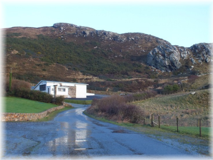
Eaglais Stella Maris

Thosaigh an t-ullmhúchán don Domhnach i ndiaidh am dinnéir ar an Satharn tí s'againne nuair a bhí mé ag fás aníos. Is dócha go raibh sé mar an gcéanna in achán teach ag an am. Bhí an mhóin agus an t-uisce le tabhairt isteach, bhí na bróga le glanadh agus snas le cur ar an teach. Nuair a thiofadh an tráthnóna, bhí an scála le tabhairt amach agus an ghruaig le ní. Nach raibh sé iontach an méid oibre a fuarthas amach as scála uisce ag an am. Is dócha go mbeidh aiséirí ar na scálaí anois nuair atá na táillí le díol againn ar an uisce.