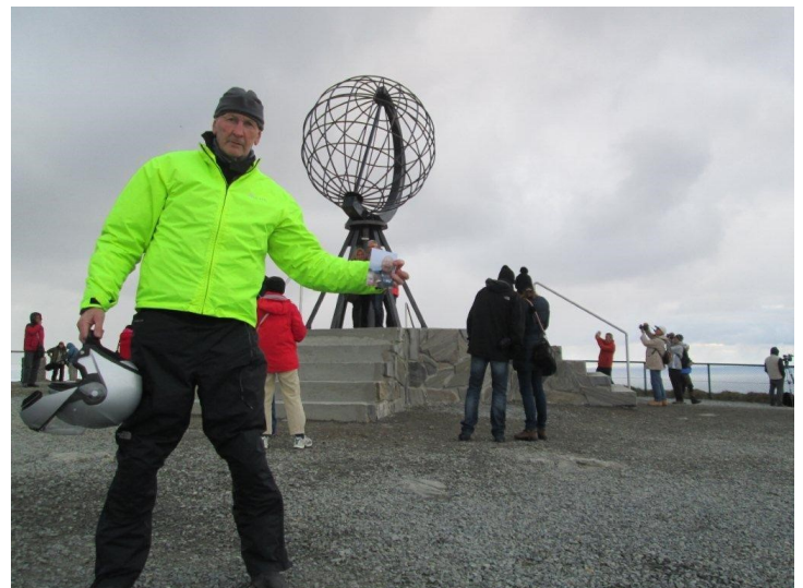
Nordkapp, Sea, bhí mé ann.

Deir sé nach bhfuil a mhacasamhail de thuras a chur sa dialann aige go luath, cibé turas a dhéanfaidh sé amach anseo dhéanfaidh sé é ar a shuaimhneas!