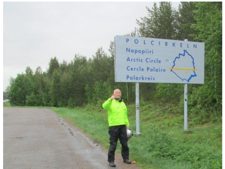
Ag trasnú an Ciorcal Artach