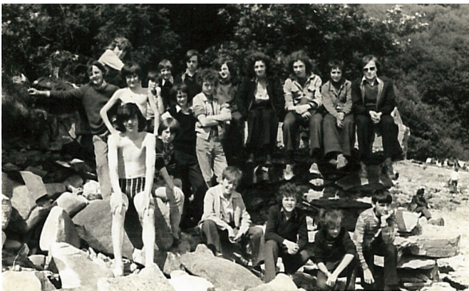
Daltaí Cois Trá i mBun na Tuinne, Gleann Bharr, 1967

Bliain i ndiaidh bliana rinne muid cúrsaí d'ardchaighdeán a chur ar fáil do dhaltaí agus phill cuid mhór acu ar an Ghleann go minic. D'éir tuairiscí uile na Roinne bhí coláiste den chéad scoth againn. Chomh maith leis sin ní raibh ach an deafhocal 'nár dtaobh ag tuismitheoirí 's ag iarscoláirí. Leag muid an-bhéim ar dhrámaíocht, ar dhíospóireacht, ar an cheol 's rince, ar chluichí, ar shiúlóidí, ar dhreapadóireacht 's ar shnámh ar thránna áille an Ghleanna féin 's ar an Trá Bhán i bPort a' tSalainn. Go rialta bhain múinteoirí an Choláiste úsáid as a ngluaisteáin féin chun daltaí a iompar fhad le tránna agus ar ais. Dochreidte a déarfainn anois, ag smaoineamh siar. D'fhreastail me féin ar gach cúrsa