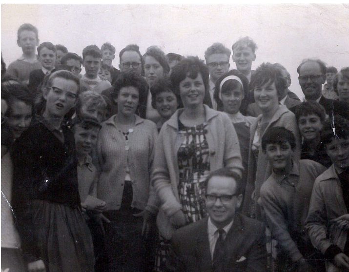
Coláiste Anagaire - Mí Iúil 1963