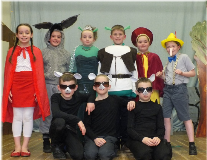
Rang 3 & 4 sa Dráma "Shrek"