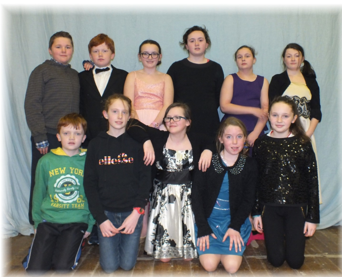
Rang 5 & 6 sa Dráma "An Culaith"