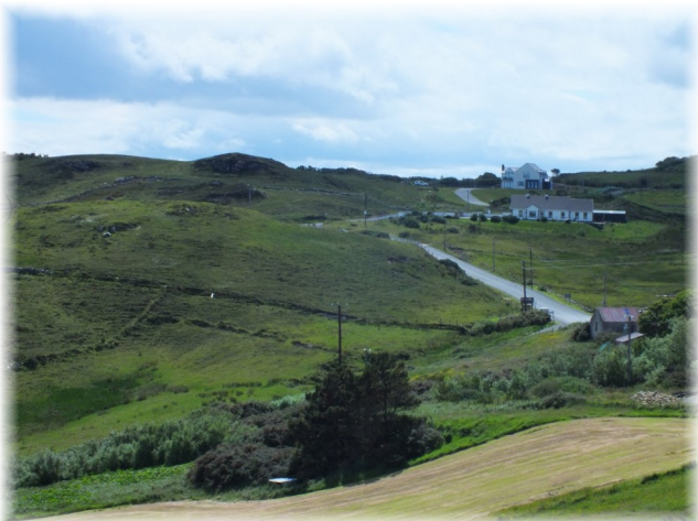
Malaidh Chluain tSaileach