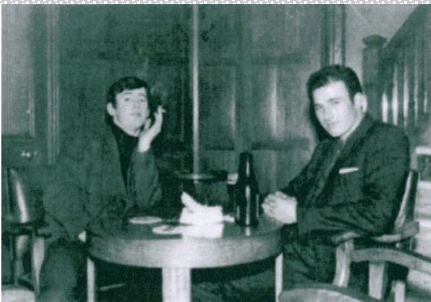
AN U-ΔΙΤΗΝΙΟΝ ΣΙΒΗ ΔΝ ΟΔ ΟΥΔΡΑΧ ΣΕΟ?? ΣΤΑΔΙΟΝ ΔΝ ΣΤΡΙΑΝΣΤΡΑΦ ΣΕΟ ΣΑ CAMBRIDGE ARMS, KILBARR PARK, LONDAN, ΛΑ' LE ΡΑΔΡΑΙΣ 1966.