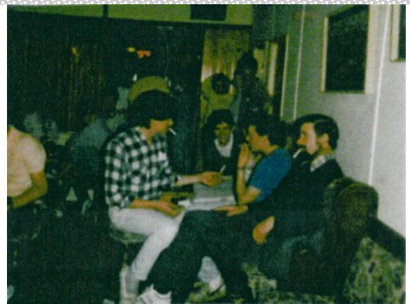
Ο' ΦΕΙΟΙΡ ΣΟ ΜΒΕΙΘΗ ΚΑΙΡΟ ΔΑΑ ΣΕΟ ΝΙΟΣ ΦΥΣΑ Δ ΔΙΤΙΝΤ!! ΣΤΑΔΙΟΝ ΔΝ ΣΤΡΙΑΝΣΤΡΑΦ ΣΕΟ ΣΑ ΣΙΒΙΝ ΚΕΟΙΛ ΔΡ ΔΝ 30Ϊ ΙΛΙΛ 1987.